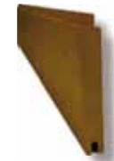
Planche à clins

Longueur 180 + 150 + 120 cm Livrable en Garapa, 21 x 145 mm, section utile: 135 mm