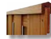
Latte de recouvrement 3

La finition idéale pour les panneaux, 180 cm