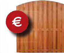
Panneau arrondi 10