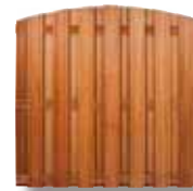
Panneau arrondi 9