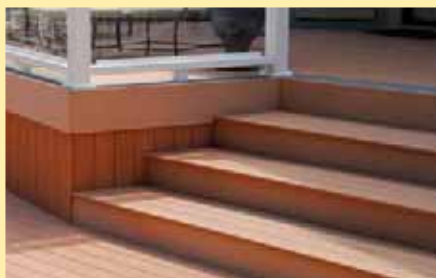
Impression à la page 19