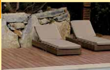
Impression à la page 20