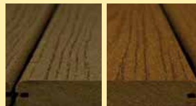
Professional : brun / gris